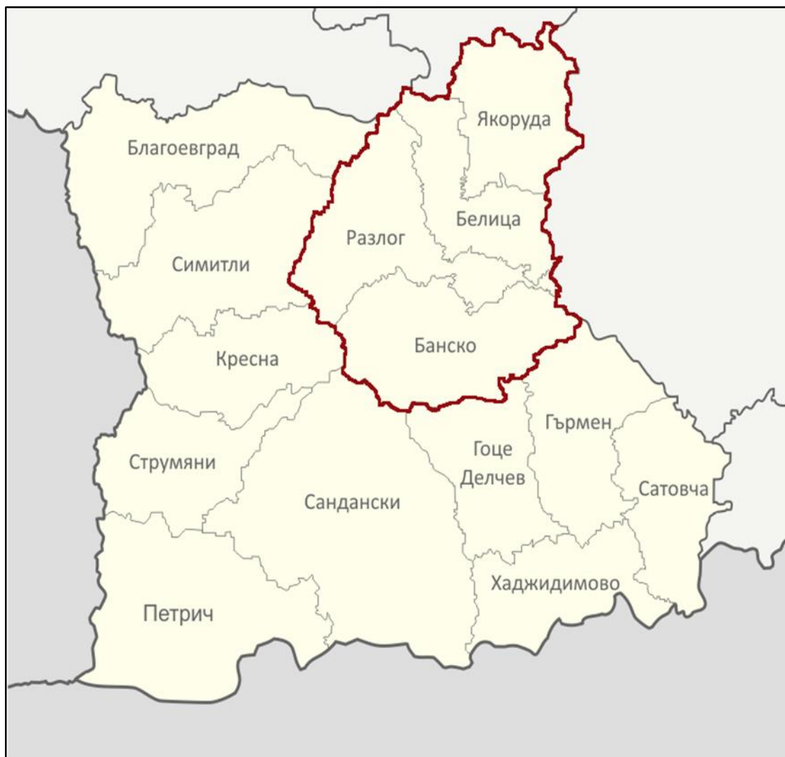
Фигура I-01: Административна карта на Област Благоевград с означен обхват на регион за управление на отпадъците Разлог